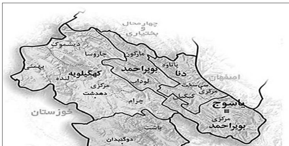
نقشه شماره ۱: موقعیت جغرافیایی شهر یاسوج

طبق آمار منتشر شده توسط مرکز آمار ایران در سال ۱۴۰۰ در کشور ۲۰۵۳۹۴ هزار دانش‌آموز مقطع متوسطه دوم وجود داشت که از این تعداد ۱۲۵۷۹۷ دانش‌آموز پسر و ۷۹۵۹۷ دانش‌آموز دختر بودند (خبرگزاری ایسنا، ۲۸ / ۷ / ۱۴۰۰). از این تعداد ۹۸۷۹ دانش‌آموز در مدارس دولتی و غیردولتی شهر یاسوج حضور داشتند. ۵۱۴۸ نفر از این افراد را دانش‌آموزان پسر و ۴۷۳۱ نفر را دانش‌آموزان دختر تشکیل می‌دادند. (آموزش و پرورش استان کهگیلویه و بویراحمد، ۱۴۰۰)