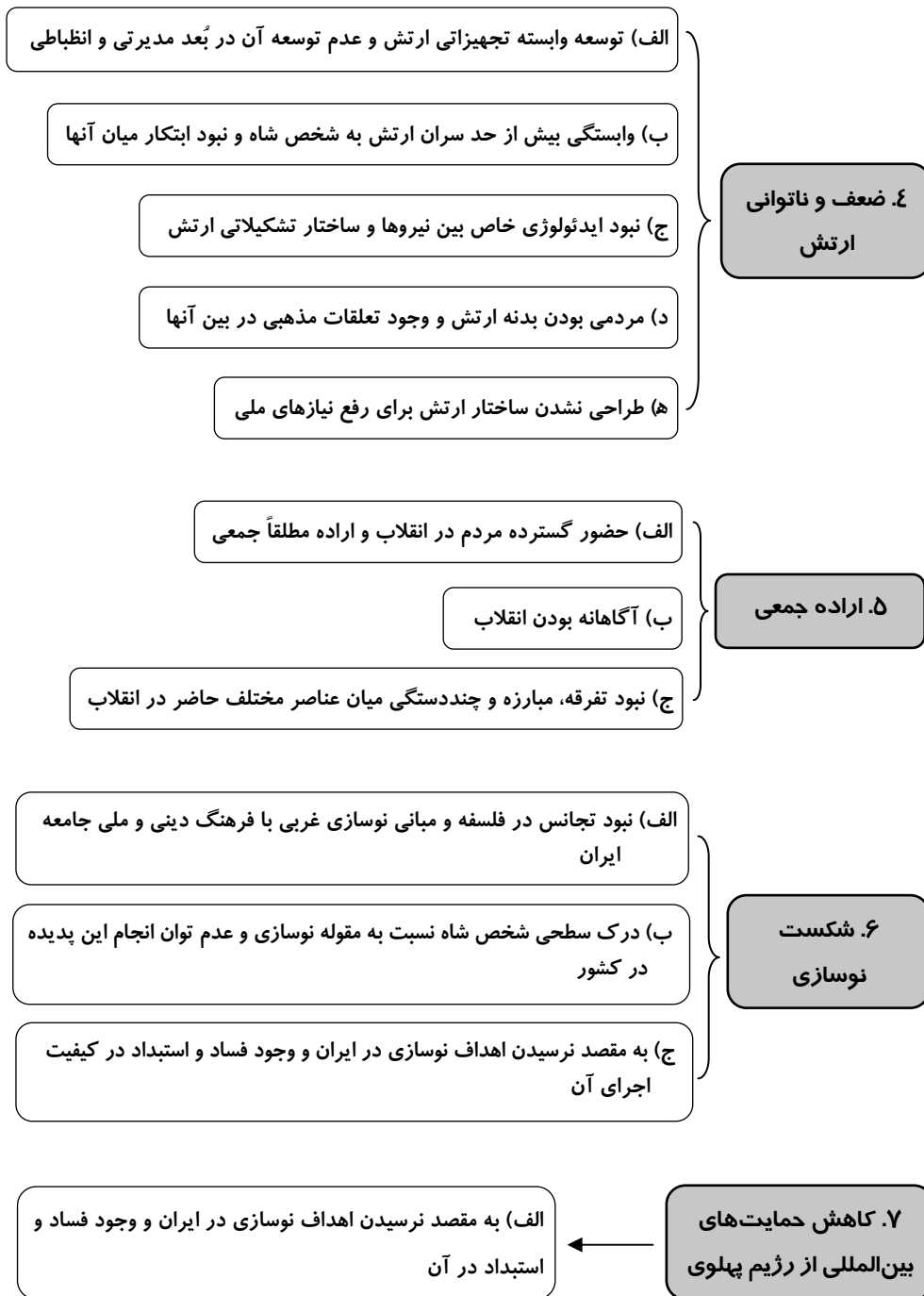
شکل (۲) عوامل مؤثر در شکل‌گیری و وقوع انقلاب اسلامی از دیدگاه میشل فوکو