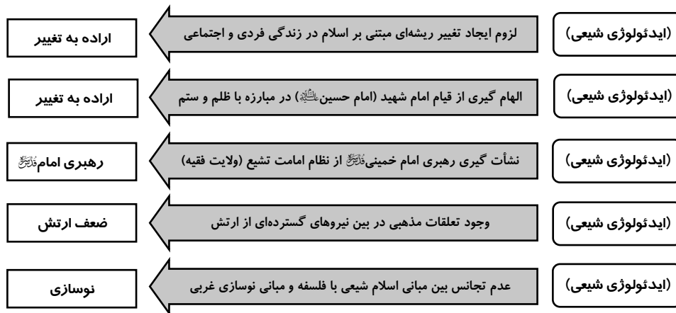
شکل (۳) چگونگی تأثیر «ایدئولوژی شیعی» بر سایر عوامل مؤثر در شکل‌گیری و پیروزی انقلاب اسلامی