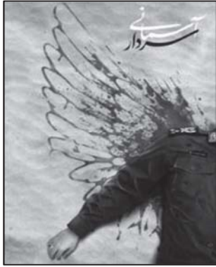
تصویر ۱۱: ایجاز تصویری و القای مفهوم شهادت (نهضت مردمی پوستر انقلاب، ۱۳۹۸/۱۰/۱۷)

سردار سلیمانی است. پوسترها و بیلبردها برخی ویژگی‌های شخصیتی را نشان داده‌اند، مانند ولایت‌مداری در تصویر ۳ و نیز کاربرد چهره‌های متبسم وی که نشان از مهربانی است. در برخی پوسترها عبارت سردار خوبی‌ها، فاتح قلب‌ها، منش‌های اخلاقی سردار را به مخاطب معرفی می‌کند. نیایش و نماز از دیگر مشخصه‌های این مرد آسمانی است.