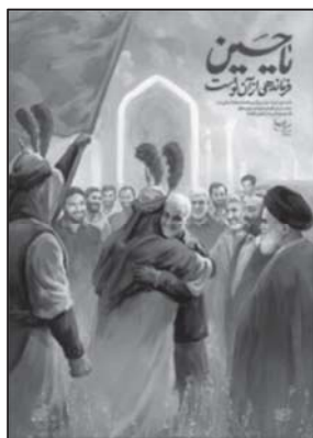
تصویر ۱۲: پیوستن شهید سلیمانی به ارواح طیبه شهدا (خبرگزاری مشرق، ۱۴/۱۰/۱۳۹۸)

است (تصویر ۱۱) که عبارت است از حذف جزئیات تا حد مبانی ضروری است. (استینسون، ۱۳۹۰: ۹۹)