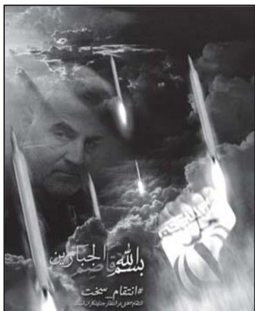
تصویر ۲: مفهوم انتقام سخت در پوستر سردار سلیمانی. (خبرگزاری اهل بیت، ۱۳۹۸/۱۰/۲۳)

تئوری‌های شناخته‌شده مفاهیم نمادین رنگ و نیز روان‌شناسی رنگ در نظریه لوشر، ۱ رنگ قرمز را محرک اراده برای پیروزی و اشکالی از نیروی زندگی، قدرت و توانایی بیان می‌کند. از نظر لوشر رنگ قرمز رویارویی با اراده یا قدرت اراده را بیان می‌کند و از نظر سمبلیک مانند خونی است که به هنگام فتح پیروزی ریخته می‌شود. (لوشر، ۱۳۷۰: ۸۴) (تصویر ۱)