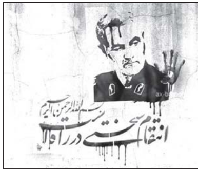
تصویر ۱: مفهوم انتقام در پوستر سردار سلیمانی

با رفتن سردار شهید قاسم سلیمانی ... انتقام سختی در انتظار جنایتکارانی است که دست پلید خود را به خون او آلودند. (پایگاه اطلاع‌رسانی دفتر مقام معظم رهبری، ۱۳/۱۰/۹۸)