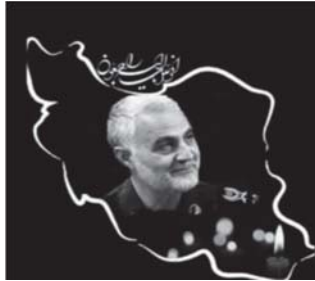
تصویر ۱۴: القای مفهوم اندوه مردم ایران از طریق استعاره تصویری. (نهضت مردمی پوستر انقلاب، ۱۳۹۸/۱۰/۱۷)

ناگفته پیداست که با شهادت سردار سلیمانی اندوه از دست دادن قهرمان مبارز پیروزمند بر قلب‌های مردم ایران جاری شد، هرچند شهادت آرزوی سردار بود؛ اما غم جدایی از سردار عزیز، بخشی از تاریخ شفاهی ملت ایران خواهد بود. نکته‌ای که امام خامنه‌ای به خوبی به آن اشاره کرده‌اند. عبارت «ایران شود عزادار تو ای سردار مملکت» در برخی پوسترها نیز همین مفهوم را بیان می‌دارد.