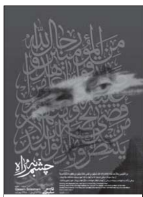
تصویر ۱۳: وفای به عهد و شهادت در راه خدا مفهوم پوستر. (خبرگزاری آنا، ۱۷/۱۰/۱۳۹۸)

یکی از ویژگی‌های شهید سردار سلیمانی، شوق و اشتیاق برای شهادت و پیوستن به ارواح شهدا بود. موضوعی که جمله اول پیام امام خامنه‌ای درباره ایشان است: «دیشب ارواح طیبه شهیدان، روح مطهر قاسم سلیمانی را در آغوش گرفتند.» پوستر شماره ۱۲، سردار سلیمانی را در میان حلقه‌ای شادمان از شهیدان و رستگاران راه خدا نشان می‌دهد که در پلان اول تصویر و در صدر حلقه، امام حسین علیه السلام ، حضرت ابوالفضل علیه السلام و امام راحل علیه السلام قرار گرفته است.