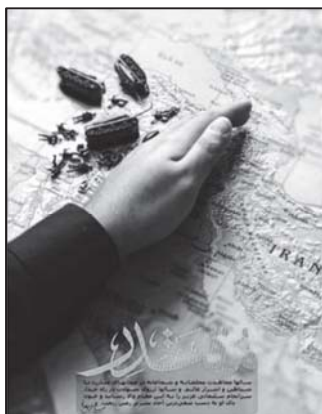
تصویر ۷: قدرت و اقتدار و امنیت معنای اصلی نشانه‌های پوستر نشانه‌ها از طریق استعاره مفاهیم را بیان می‌کند. (نهضت مردمی پوستر انقلاب، ۱۳۹۸/۱۰/۱۷)

باید توجه داشت که در میانه «لا» قطره خون شهیدی قرار گرفته است که نشانه ارجاع مستقیم به شهادت و مبارزه دارد. مهم‌ترین عناصر معنایی این پوستر نوشتارهای قرآنی آن است که زنده بودن شهید، نترسیدن مؤمنان و نیز محزون نشدن آنها از شنیدن خبر شهادت را بیان می‌دارد.