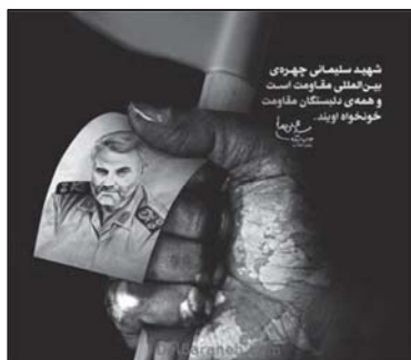
تصویر ۴: مفهوم ایستادگی و مقام، مفهوم استعاری نشانه‌های دست و پرچم قرمز.

گفتنی است ایستادگی در برابر ظلم و مقاومت بخشی از فرهنگ ایران و اسلام است که مرجع ظهور