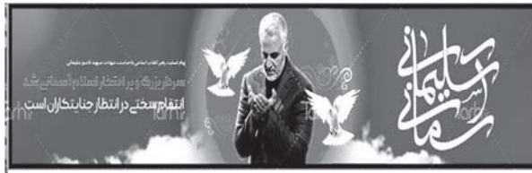
تصویر ۱۰: ویژگی‌های شخصیتی سردار سلیمانی، نیایش و عبادت، کاربرد نمادهای نور، کبوتر (طرح دات آی آر، ۱۳۹۸/۱۰/۱۸)

عظوفت و مهربانی در کنار سایر ویژگی‌های شخصیتی ایشان، مانند: ولایت‌مداری، اقتدار، ایمان و جهاد از مشخصه‌های شخصیتی