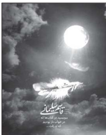
تصویر ۹: تداعی حس امنیت از طریق نشانه‌های استعاری. (خبرگزاری اهل بیت، ۱۳۹۸/۱۰/۲۳)

برخی از پوسترها حس امنیت و آسایش مردم را در سایه اقتدار سردار سلیمانی بیان می‌دارند و اندوه