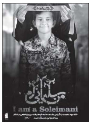
تصویر ۱۶: القای مفهوم تداوم راه قاسم سلیمانی از طریق تصویر و نوشتار (نهضت مردمی پوستر انقلاب، ۱۳۹۸/۱۰/۱۷)

یکی از عمیق‌ترین معانی پوسترها و بیلبردهای حاج قاسم سلیمانی، تداوم راه اوست. پیام‌هایی همچون «حاج قاسم زنده است، من سلیمانی‌ام، سلیمانی‌ها در راهند» در این پوسترها به چشم می‌خورد. پوسترها این پیام رهبری را به مخاطب منتقل می‌کنند که خط جهاد مقاومت با انگیزه مضاعف ادامه خواهد یافت.