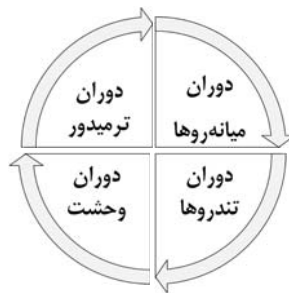
نمودار (۲): دوره‌های انقلاب

در مجموع روند انقلاب از منظر برینتون را می‌توان در قالب نمودار زیر به‌نمایش گذاشت: